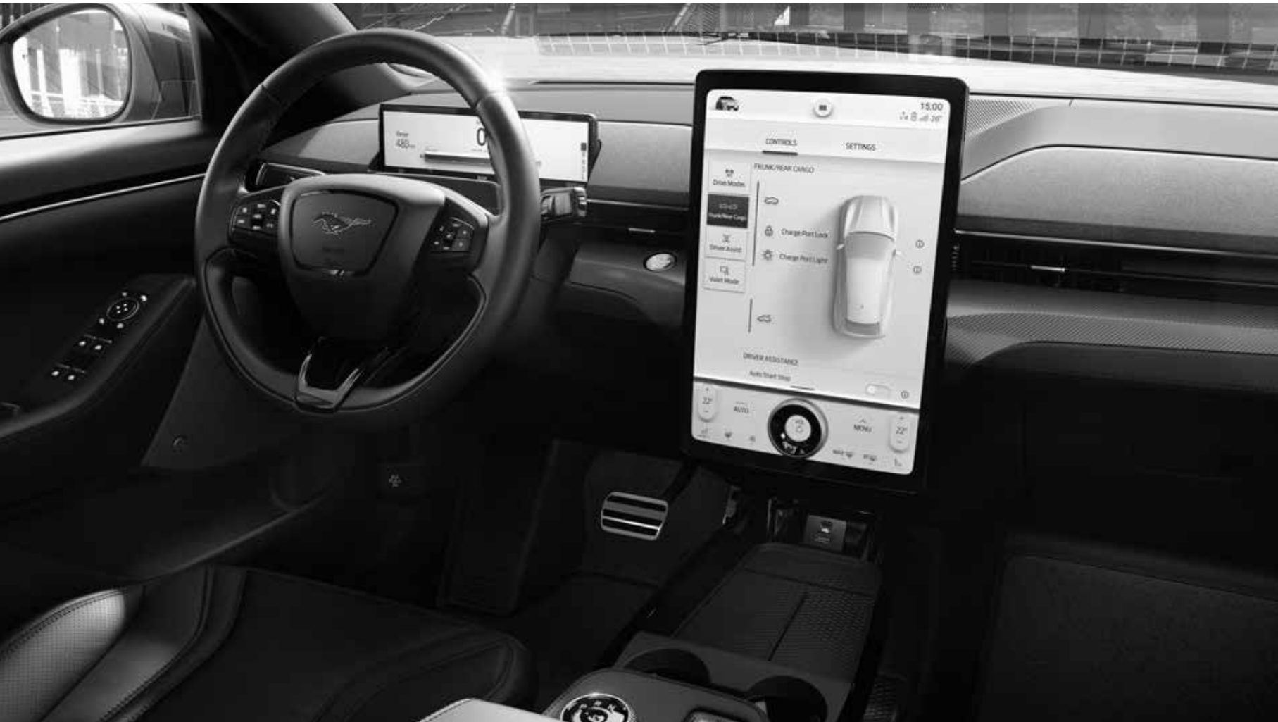
Abbildung zeigt serienmäßige Ausstattung des Ford Mustang Mach-E AWD.