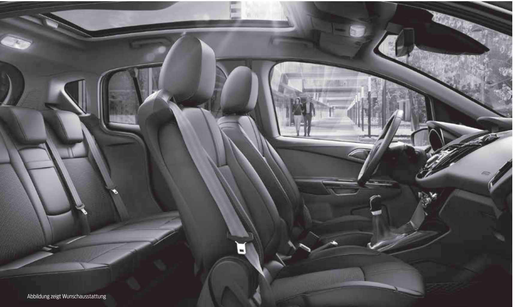
Abbildung zeigt Wunschausstattung