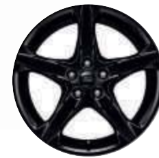
18"-Leichtmetallräder im 5-Speichen-Design, schwarz lackiert (Serienausstattung)

Focus ST-Line Red mit 18"-Leichtmetallrädern in Schwarz. Focus ST-Line Black mit 18"-Leichtmetallrädern in Schwarz.