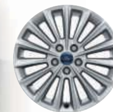
17"-Leichtmetallräder im 15-Speichen-Design (Zubehör)