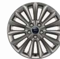
17"-Leichtmetallräder im 15-Speichen-Design, in Rock Metallic (Serienausstattung)