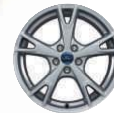
18"-Leichtmetallräder im 5x2-Speichen-Design (Wunschausstattung)